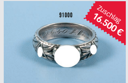
Losnr. 91000 Ehrenring