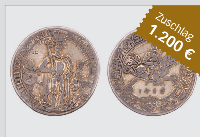
6061 RDR, Erzherzog Sigismund (1439-1490), Guldiner 1486, Hall