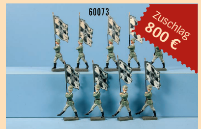
Losnr. 60073 9 Lineol Fahnenträger