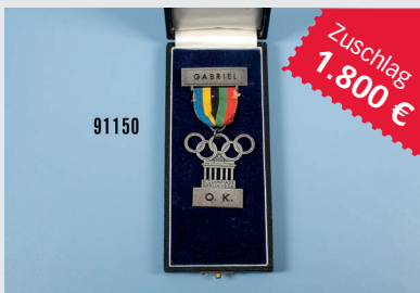
Losnr. 91150 Olympia-Abzeichen