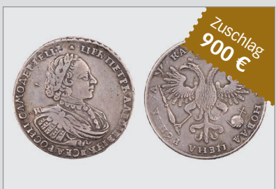
6040 Russland, Peter der Große (1682-1725), Rubel 1721