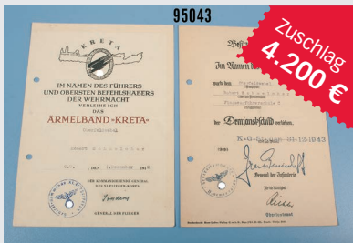
Losnr. 95043 Dokumentennachlass 2. WK