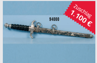
Losnr. 94000 Reichsbahndolch