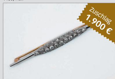
9009 Konv. Art Deco Schmuck aus Platin mit Brillanten