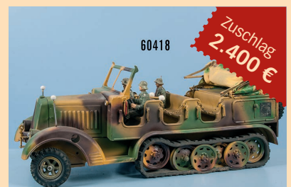
Losnr. 60418 Halbketten-Mannschaftswagen