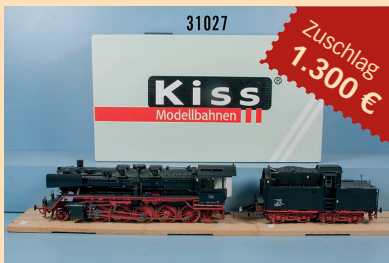
Losnr. 31027 Kiss Spur 1 128101 Schlepptenderlokom