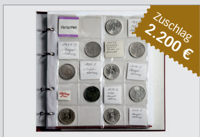
5091 sehr umfangreiche Sammlung von DM-Fehlprägungen und Varianten

Wichtiger Hinweis: Zuschlagpreise ohne Aufgeld