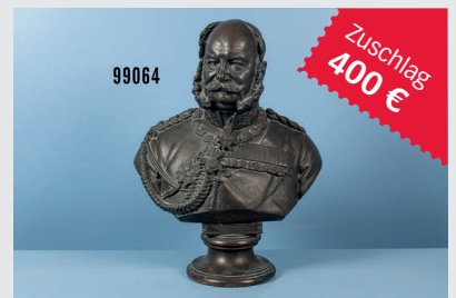
Losnr. 99064 Kaiser Wilhelm Büste