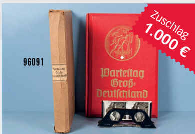
Losnr. 96091 Raumbildalbum