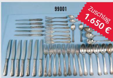
Losnr. 99001 Offizier-Besteck