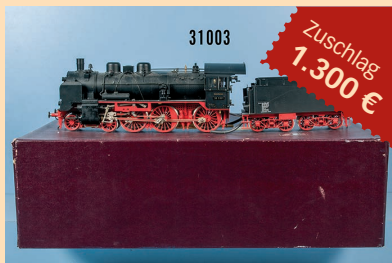
Losnr. 31003 Aster Spur 1 Schlepptenderlokom