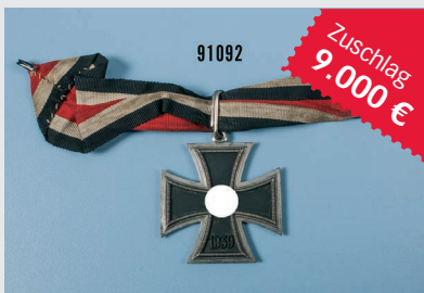
Losnr. 91092 Ritterkreuznachlass