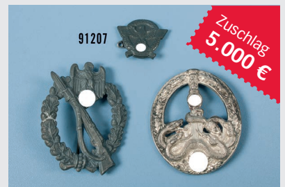
Losnr. 91207 Bandenkampfnachlass