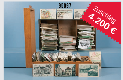
Losnr. 95097 Postkartenkonvolut