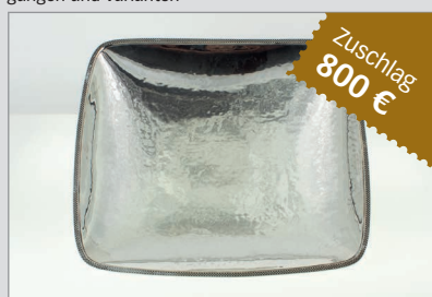
8001 Obstschale auf 4 Füßen, Handarbeit (Hammer Schlag), 830er Silber