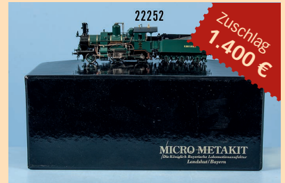
Losnr. 22252 Micro Metakit H0 95301 Schlepptenderlokom