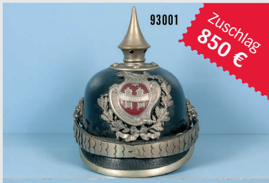
Losnr. 93001 Polizei-Pickelhaube