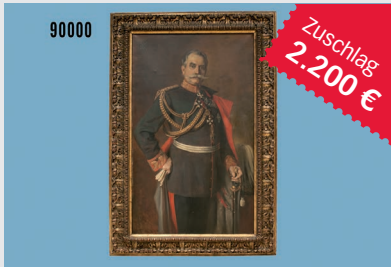
Losnr. 90000 Ölgemälde

Wichtiger Hinweis: Zuschlagpreise ohne Aufgeld