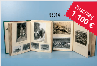
Losnr. 95014 Fotonachlass 2. WK