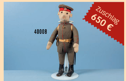
Losnr. 40008 Steiff Filzpuppe Soldat 1. WK