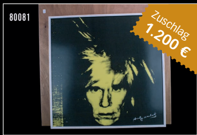
Losnr. 80081 Rosenthal Porzellan Wandbild A. Warhol, Dekor Andy Warhol