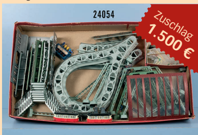
Losnr. 24054 Stube H0 Startpackung Wuppertaler Schwebbahn