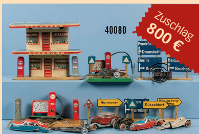
Losnr. 40080 Konv. Zubehör für Tipp-Co Autorennbahn