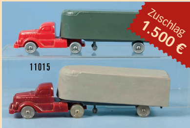
Losnr. 11015 2 Wiking H0 Solo-Zugmaschinen mit Anhänger