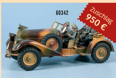
Losnr. 60342 Lineol Kübelwagen WH 8768