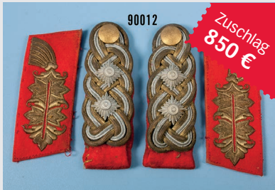
Losnr. 90012 Generalseffekten