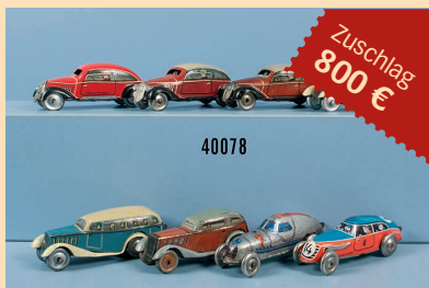
Losnr. 40078 8 Tipp-Co Fahrzeuge für Auto- und Rennbahnen