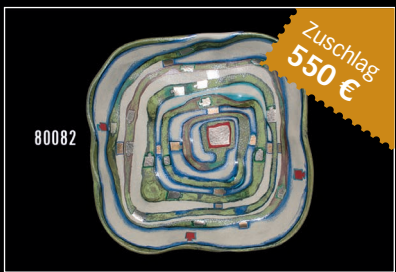
Losnr. 80082 Rosenthal Porzellan Spiralenteller F. Hundertwasser