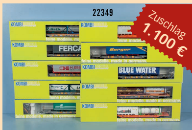
Losnr. 22349 30 KOMBIMODELL Taschenwagen