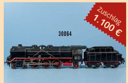
Losnr. 30064 Märklin Spur 0 HR 70/12920 Schlepp-tenderlokom