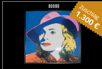
Losnr. 80080 Rosenthal Porzellan Wandbild A. Warhol, Dekor Ingrid Bergmann