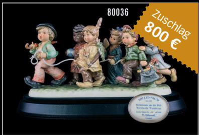
Losnr. 80036 Goebel Hummel Figur Nr. 1440 Gemeinsam um die Welt