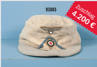
Losnr. 93005 Feldmütze