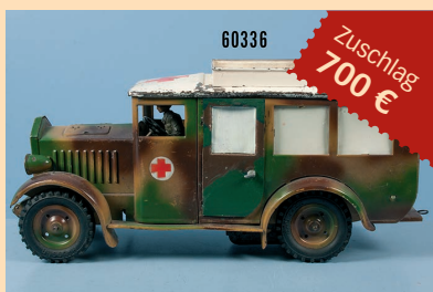
Losnr. 60336 Hauser Elastolin Sanitätsauto