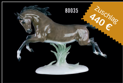
Losnr. 80035 Rosenthal Porzellan galoppierendes Pferd

Wichtiger Hinweis: Zuschlagpreise ohne Aufgeld