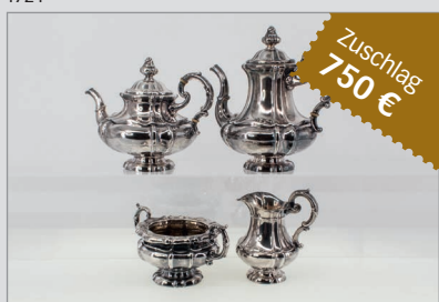
8008 Silberkonv., Bruckmann & Söhne, Heilbronn, ca. 1930